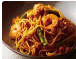
海老とアスパラ、オマール海老のラグーの自家製アメリカーナソース