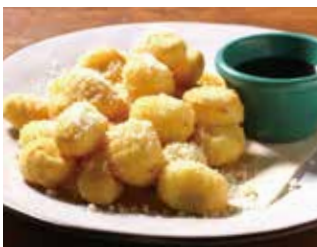
揚げニョッキ メイブルソース添え