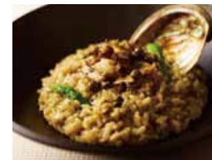
アワビのリゾット 焦がしバターの香り