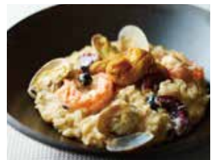
ウニと魚介のクリームソースリゾット