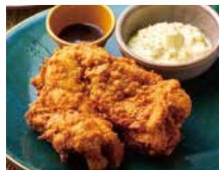
ハーブフライドチキン 2種の特製ディップソース添え

価格には容器代 ¥100(税込¥108)が含まれております。 [商品代+容器代]から20%OFF 表記価格は全て割引後の価格です。