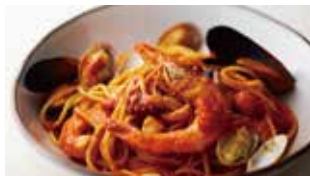
魚介たっぶりのペスカトーレトマトソース

価格には容器代 ¥100(税込¥108)が 含まれております。 [商品代 + 容器代]から20%OFF 表記価格は全て割引後の価格です。