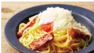
究極のカルボナーラ