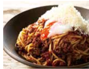
究極のポロネーゼ