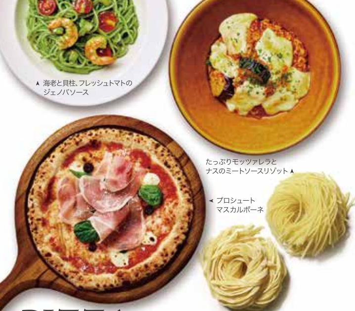
▲ 海老と貝柱、フレッシュトマトのジェノバソース